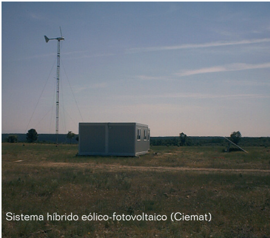
Sistema híbrido eólico-fotovoltaico (Ciemat)

do para la conexión a red conlleve una disminución de costes notable, así como un aumento de la fiabilidad de los mismos que también será aprovechado para su uso en sistemas aislados, híbridos principalmente.