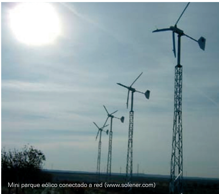
Mini parque eólico conectado a red ( www.solener.com )

En realidad, la ED no es concepto nuevo, pues ya Edison en su concepción de la primera red de distribución la concebía como una red distribuida, con unidades de generación en cada edificio. Lo que